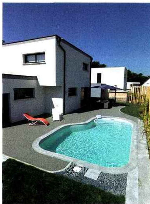
▲ Ce modèle a été récompensé lors des derniers Trophées de la Piscine, dans la catégorie «Piscine citadine inférieure à 30 m 2 de forme libre». Une ligne contemporaine, une piscine compacte et bien équipée grâce à son escalier intégré de série. Waterair, Cléa.

referme. Cette solution vous permet de joindre l'utile à l'agréable : votre espace piscine est sécurisé et vous disposez d'une jolie terrasse. Dans l'optique de gagner de la place toujours, les petites structures se font de plus en plus pratiques et économiques, dans un design qui n'a rien à envier