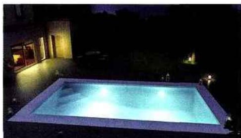
▲ Une piscine spécialement conçue pour savourer les plaisirs de l'eau en famille ou entre amis. Composée de 2 plages de profondeurs différentes, ce modèle réunit dans un même bassin 2 espaces de jeu. Aquilus, concept Dooplex, à partir de 8.999 € environ.

ter en toute sécurité ! Lippi, clôture et portillon Decorella® 3.